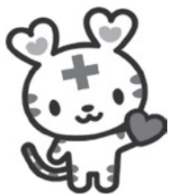
日本赤十字社 公式マスコットキャラクター 「ハートラちゃん」

お寄せいただいた協力金は、国内外の災害救援活動(医療チーム派遣など)の他、町内等の掲示板設置・血液事業・赤十字奉仕団の活動などの財源となっております。今後とも、赤十字事業へのご協力をお願いいたします。