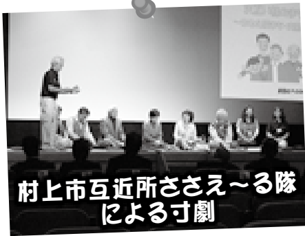
村上市互近所ささえ～る隊 による寸劇