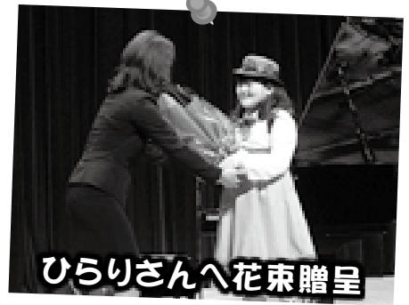
ひらりさんへ花束贈呈