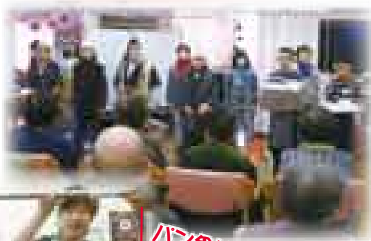
パン食い競争 がんばるぞ!!