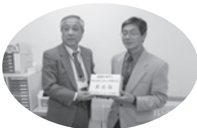
猿沢地域まちづくり協議会様より寄付