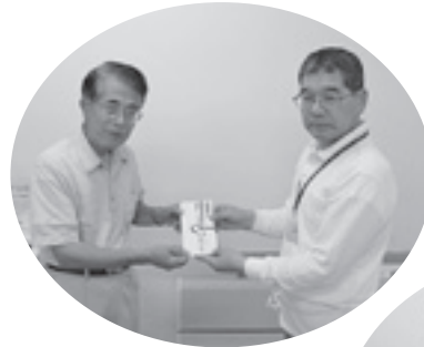
山居町一丁目様より 寄付