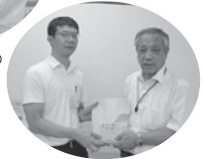
山辺里地区まちづくり 協議会様より寄付