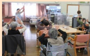
踊りを取り入れた体操