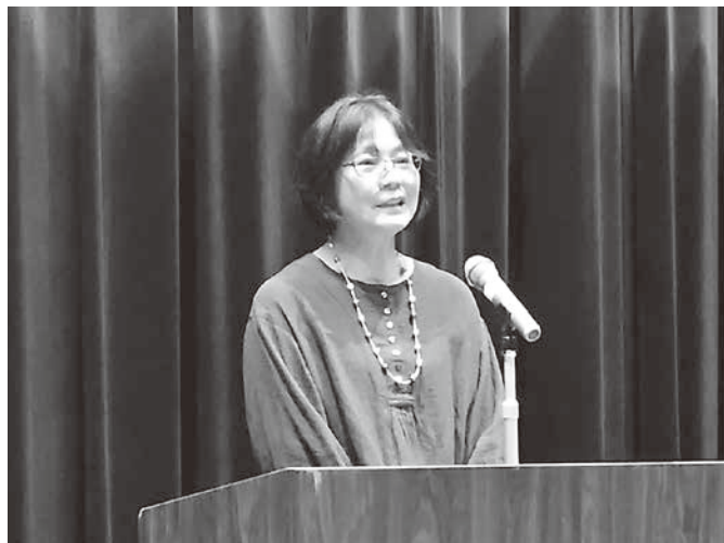
南田中の茶の間 謝辞