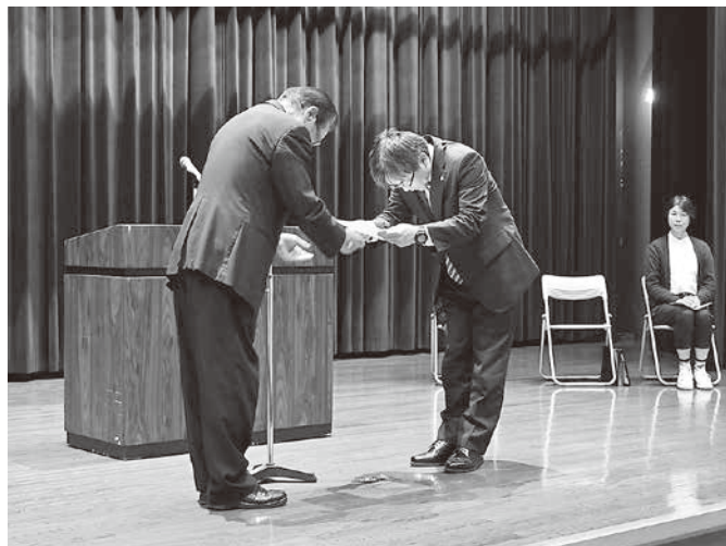
村上桜ヶ丘高等学校 目録贈呈