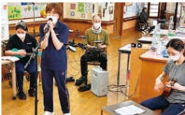
職員でバンド結成：リリースカンパニー (ゆり花荘)