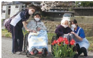
ひなたぼっこ（さわらびセンター）

デイサービスセンター（さくら荘・きわなみ荘・新きわなみ荘・さわらびセンター・ゆり花荘）では、季節ごとにご利用者と近隣へバスハイクをしたり、施設内で様々な行事を楽しんでいます。