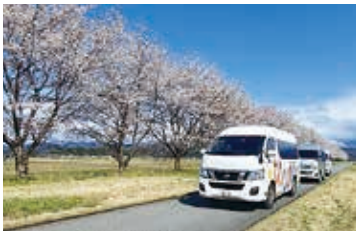
桜めぐり (きわなみ荘・新きわなみ荘)

社協むらかみは、資源保護のため古紙配合率70%再生紙と環境にやさしい大豆インクを使用しています