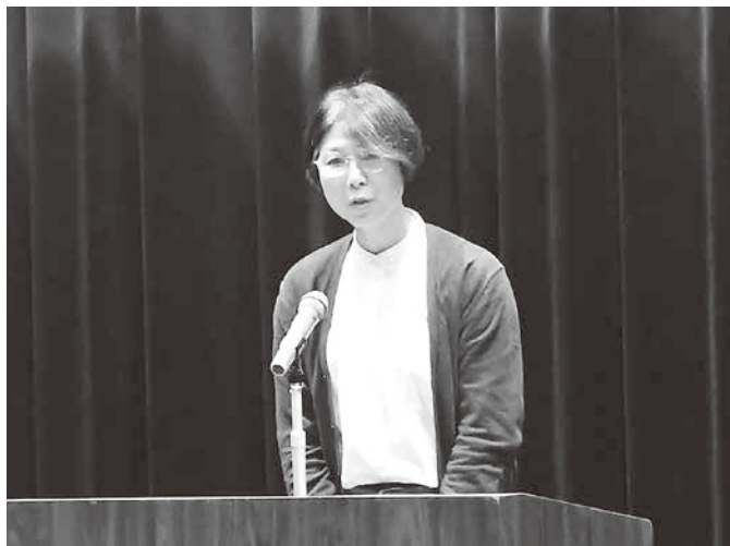
フードバンクさんぽく 謝辞