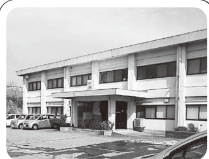
村上市社会福祉協議会