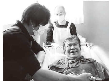
訪問入浴むらかみの様子

居宅介護支援事業(3事業所:居宅介護支援むらかみ・あらかわ・あさひ)、訪問介護事業(3事業所:ヘルパーステーションむらかみ・あさひ・さんぼく)、訪問入浴介護事業(1事業所:訪問入浴むらかみ)、通所介護事業(5事業所:さくら荘・きわなみ荘・新きわなみ荘・さわらびセンター・ゆり花荘)