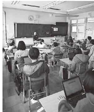
福祉学習総合発表会

住民主体のたすけ合い活動推進、暮らし支えあい事業、居場所推進・支援事業、ご近所活動助成事業、生きづらさを抱える人への支援事業、生活困窮世帯への支援事業、一人暮らし高齢者交流事業、ほのぼのお便り事業、理美容費助成事業、視覚障がい者支援業、手話奉仕員・要約筆記奉仕員事業、移送サービス事業(朝日地区)、福祉の便利帳作成事業、地域福祉活動計画の推進、ボランティア相談・支援、ハッピーボランティアポイント事業、災害時における連携体制の構築、福祉教育推進事業、学用品贈呈事業、多職種連携、ふくしまマーケットの開催、共同募金運動の推進、各種団体への支援・協力