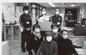
JA北新潟女性部岩船地区様