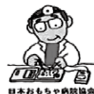
日本おもちゃ病院協会