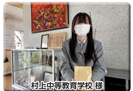
村上中等教育学校様