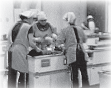
調理実習(職員研修)の風景