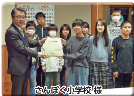
さんぽく小学校様

社協むらかみは、資源保護のため古紙配合率70%再生紙と環境にやさしい大豆インクを使用しています。