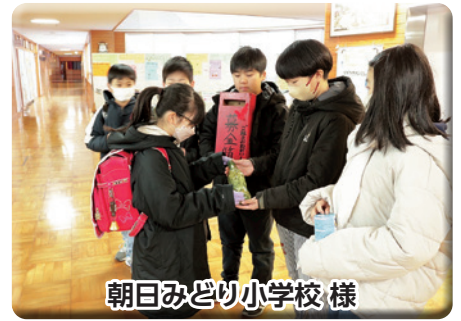
朝日みどり小学校様